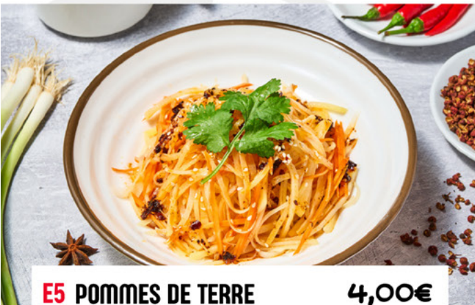
E5 POMMES DE TERRE VINAIGRÉES EN JULIENNE 4,00€ Shredded Potatoes with Vinegar 酸辣土豆丝