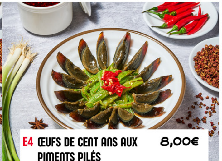
E4 ŒUFS DE CENT ANS AUX PIMENTS PILÉS 8,00€ Century Eggs with Crushed Chili Peppers 擂椒皮蛋