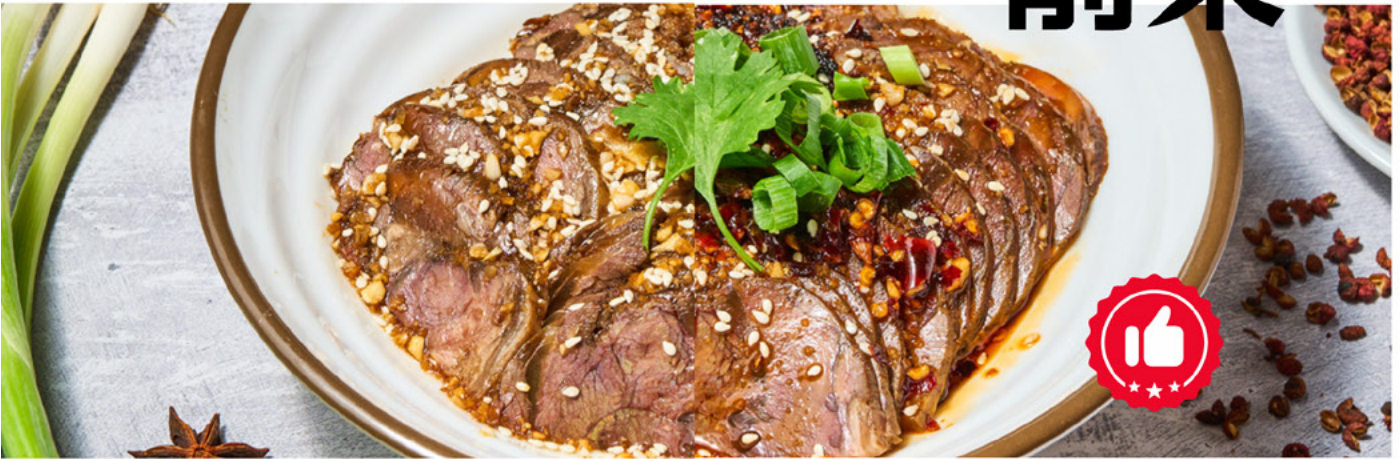
E1 BŒUF AUX CINQ ÉPICES 🐮 10,00€ Five-Spice Beef 五香牛肉