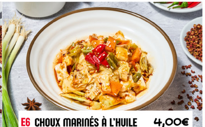
E6 CHOUX MARINÉS À L'HUILE PIMENTÉE 4,00€ Spicy Pickled Cabbage with Chili Oil 红油泡菜