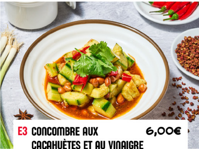
E3 CONCOMBRE AUX CACAHUÈTES ET AU VINAIGRE 6,00€ Cucumbers with Peanuts and Vinegar 老醋花生拍黄瓜